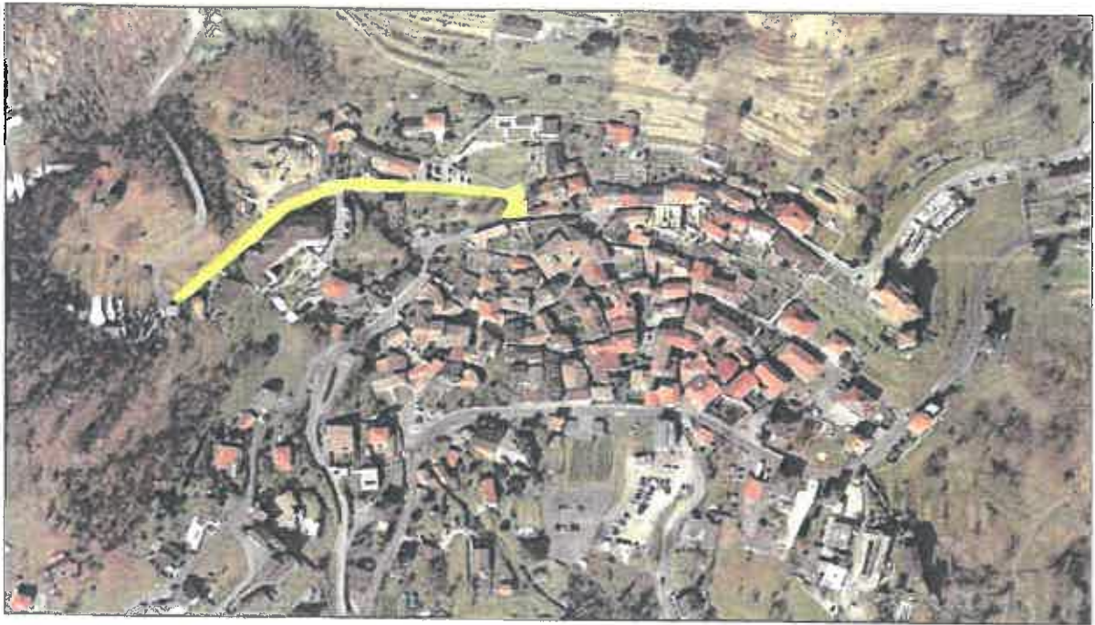
Figura 1: tratto nel quale è prevista l'estensione delle misure di moderazione del traffico.