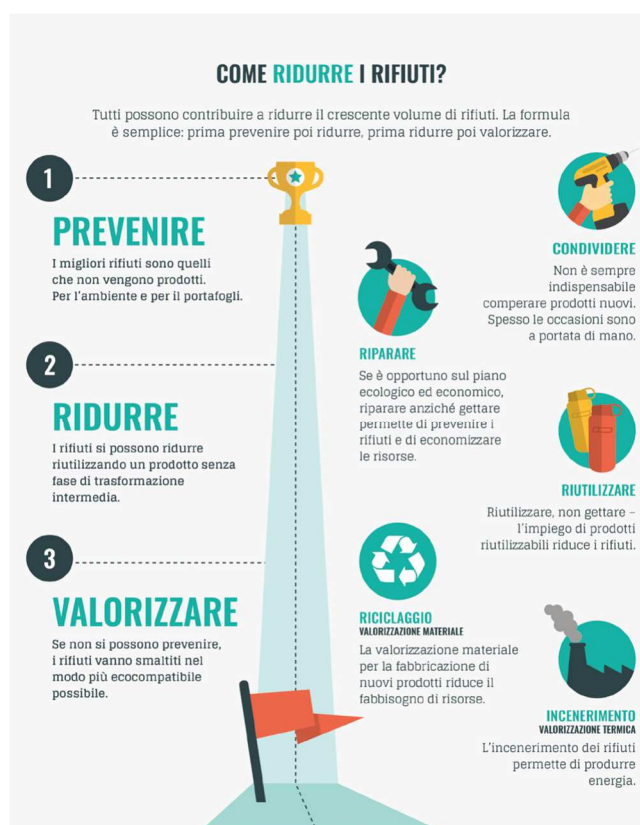
Figura 1: smaltire i rifiuti, illustrazione della situazione in Svizzera, pubblicato dall'Ufficio Federale dell'ambiente UFAM, Berna, 2016

Il Municipio si impegnerà nel corso della legislatura a diminuire i costi per lo smaltimento dei rifiuti; a questo proposito un interessante contributo per lo smaltimento 'naturale' del verde potrà arrivare dal suo utilizzo nell'ambito di un progetto legato agli orti comunali. Anche i cittadini possono ridurre i propri rifiuti (di seguito i consigli dell'UFAM - Ufficio Federale dell'ambiente)