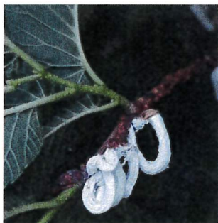
Figura 1: ovisacchi di Takahashia japonica su Olmo, Balerna 2023

Durante il 2023 è stata accertata la presenza della cocciniglia dai filamenti cotonosi ( Takahashia japonica , Tj) in alcuni comuni del Sottoceneri e a Brissago.