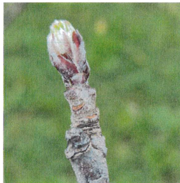
Melo, Braeburn, Mezzana, 04.03.2024 Stadio B, Rigonfiamento gemme