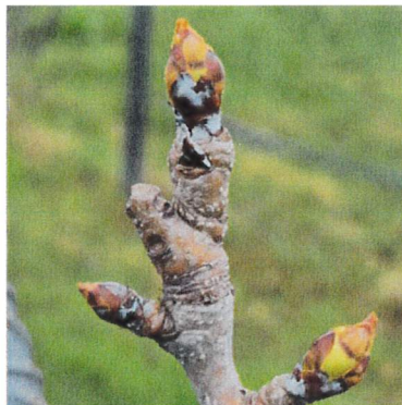
Pero, William giallo, Mezzana, 04.03.2024 Stadio B, Rigonfiamento gemme