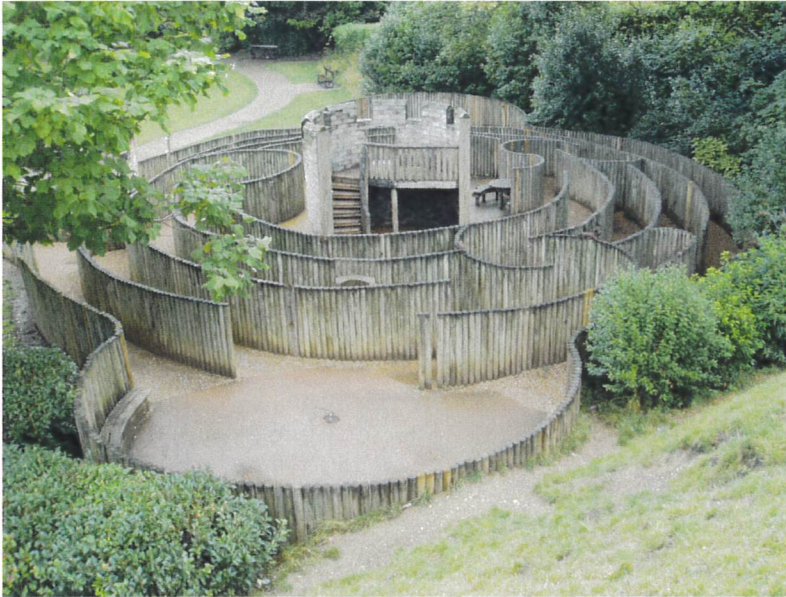
Esempio di labirinto in tondame di legno presso il Dane John Gardens di Canterbury (UK).

richiederebbe uno sforzo notevole, dato che i salici sono estremamente delicati e facilmente danneggiabili da calpestio o uso frequente. Si è pertanto optato per una soluzione che garantisca sia la magia dei nascondigli sia la praticità nella manutenzione. È stata progettata una struttura a forma di labirinto, realizzata in robusto legno di castagno, che offre una serie di passaggi intrecciati a diverse altezze (Fig. 9).