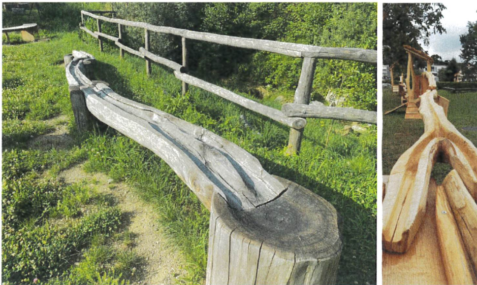
Esempi di percorso per biglie a doppio binario presso i parchi gioco di Castel San Pietro (sinistra) e Cugnasco (destra).

Un'aggiunta interessante all'area ricreativa sarà il gioco del Memory, situato vicino all'area ristoro (Fig. 17). Questo gioco coinvolge 16 schede Memory (disposte in un formato 4x4, Fig. 14, planimetria: elemento nr. 1) con dimensioni di 25x25 cm, ciascuna raffigurante elementi della flora e la fauna di Arogno. Queste schede saranno interamente girevoli, permettendo di scoprire le immagini da ogni angolazione.