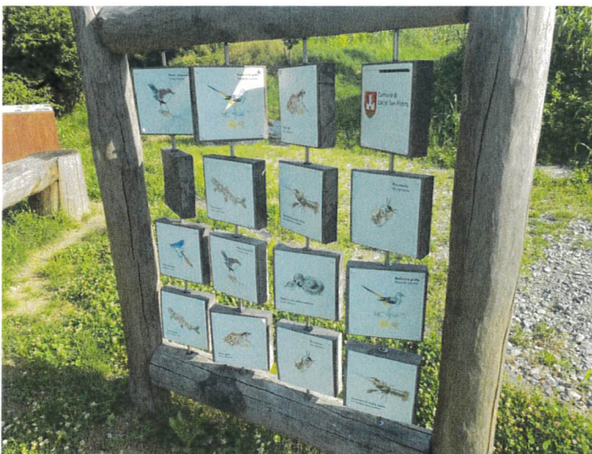
Esempio di gioco del Memory presso il parco giochi di Castel San Pietro.

Un'aggiunta interessante all'area ricreativa sarà il gioco del Memory, situato vicino all'area ristoro (Fig. 17). Questo gioco coinvolge 16 schede Memory (disposte in un formato 4x4, Fig. 14, planimetria: elemento nr. 1) con dimensioni di 25x25 cm, ciascuna raffigurante elementi della flora e la fauna di Arogno. Queste schede saranno interamente girevoli, permettendo di scoprire le immagini da ogni angolazione.