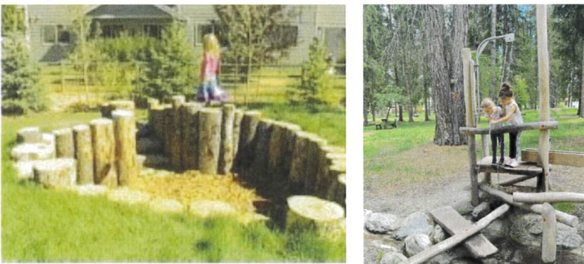
Esempi di buca delimitata con tondame in castagno (sinistra) ed elemento a carrucola (destra).

Un'attività divertente e formativa che coinvolge i sensi e favorisce lo sviluppo motorio, la creatività e l'apprendimento scientifico/matematico è giocare alla sabbia. Per rispondere a questo bisogno si è pensato di realizzare una buca di circa 20 metri quadrati a sagoma irregolare, di profondità 1 m, delimitata con tondame di castagno e riempita con geotessile e strato di ghiaietto tondo (granulometria 8-16 mm) di altezza 30-40 cm. La "buca" sarà completata con un elemento a carrucola e un secchio (Fig. 11).