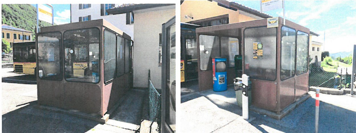
Attuale pensilina del bus

La stessa si presenta in condizioni fatiscenti ed essendo esteticamente vetusta il Municipio ha deciso d' intervenire con la completa sostituzione.